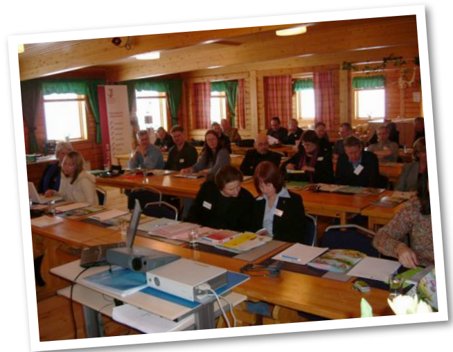
Konferens "Tåsödalen i Europa 2005"

ii) acceptens av mångfald på arbetsplatsen och bekämpande av diskriminering när det gäller att få tillgång till och gå vidare till arbetsmarknaden, också genom att involvera lokalsamhällen och lokala företag och främjande av lokala sysselsättningsalternativ (sid 39).