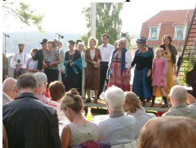
Förvaltningsmyndighet och attesterade myndighet

Rådet för Europeiska Socialfonden i Sverige